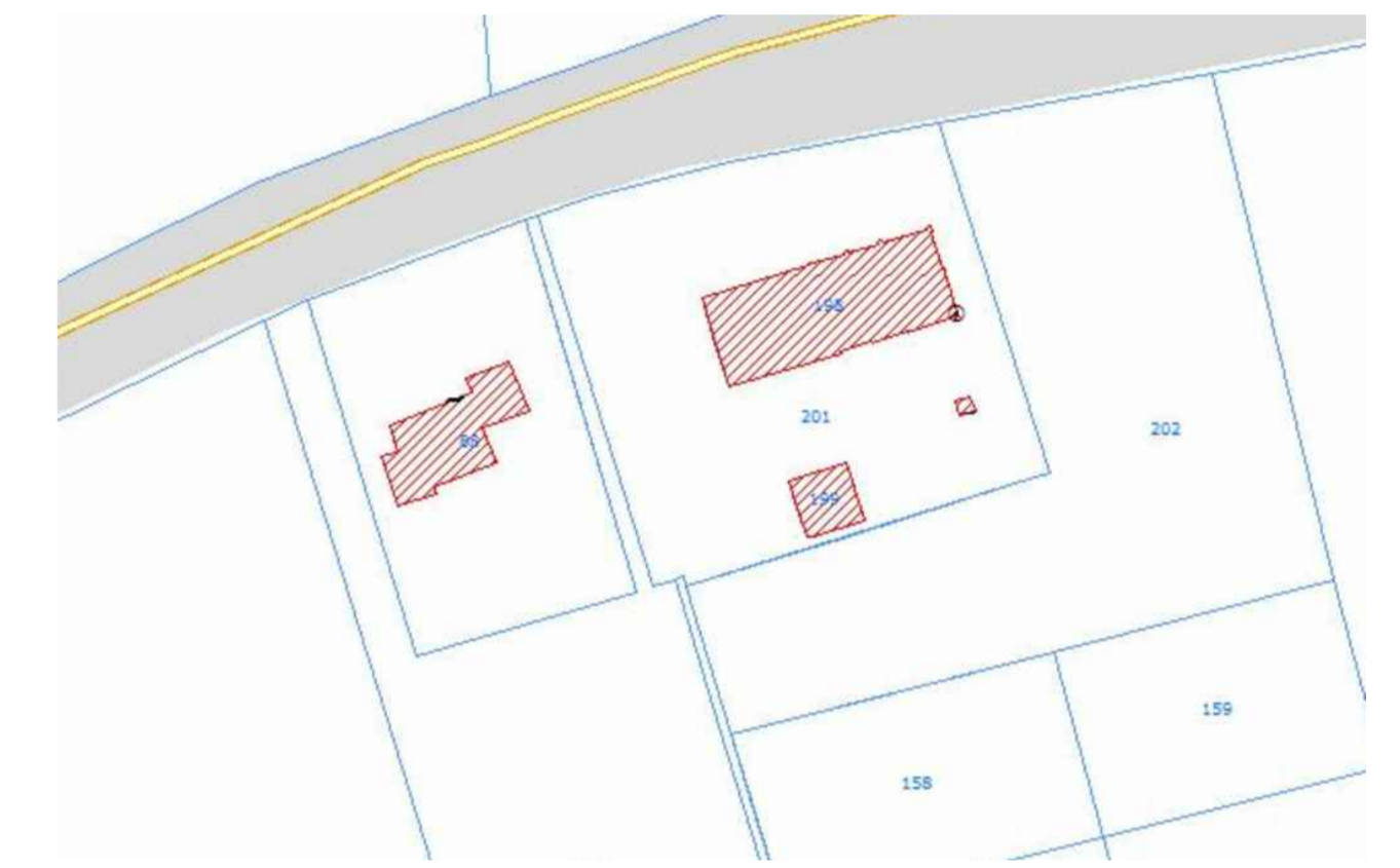
PLANIMETRIA CATASTALE scala 1:1000

L'ATTUALE APPALTO E RELATIVO ALLE SOLE DEMOLIZIONI, RIFACIMENTO COPERTURA, RIMANEGGIAMENTO DELLE PARETI ESTERNE DEL FABBRICATO CON SOSTITUZIONE DEI SERRAMENTI, DEMOLIZIONE DEI MANUFATTI ABUSIVI, RIFACIMENTO DELLE LINEE FOGNARIE E SISTEMAZIONE DELL'AREA ESTERNA. (VEDI ELABORATO PREVENTIVO LAVORI)