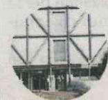
La sede di Hera a Ferrara in via Diana

seguente sospensione delle azioni di distacco, e la prima rata pari al 50% della bolletta mentre la restante parte dovuta sarà ripartita equamente nelle rate successive con importi uguali e non inferiori a 50 euro, come previsto dalla normativa. È possibile avere anche piani di rientro con la prima rata pari a solo un terzo della bolletta (questa opportunità è valida anche per le bollette emesse in date successive al 30 giugno). Per le famiglie con importi delle bollette superiori a 1.000 euro, la multiutility è disponibile a valutare richieste di rateizzazioni anche superiori ai 10 mesi, superando quindi il numero fissato