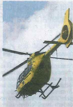
L'eliambulanza in volo

Subito è scattata l'allerta per i soccorsi e in breve, mentre veniva chiesto anche l'intervento dell'eliambulanza, sono arrivati sul posto i sanitari dell'automedica dell'Ospedale del Delta e dell'ambulanza di Comacchio.