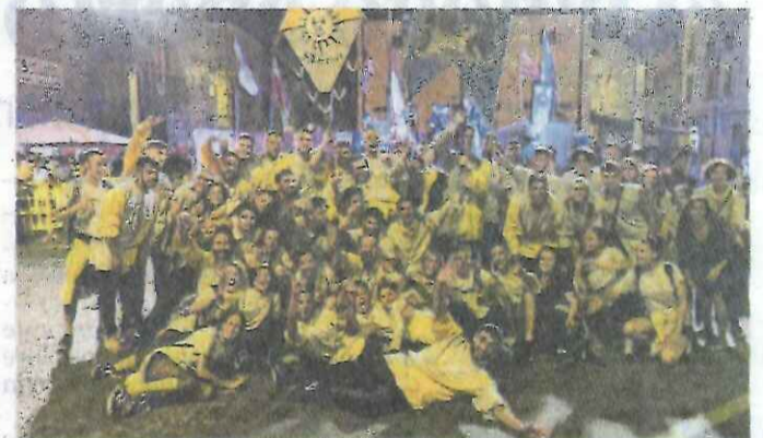
Il gruppo che ha sbaragliato le gare del Palio di Finale Emilia

La Cerchia di San Lorenzo, infatti, non solo ha vinto il Palio artistico, ma ha conquista-