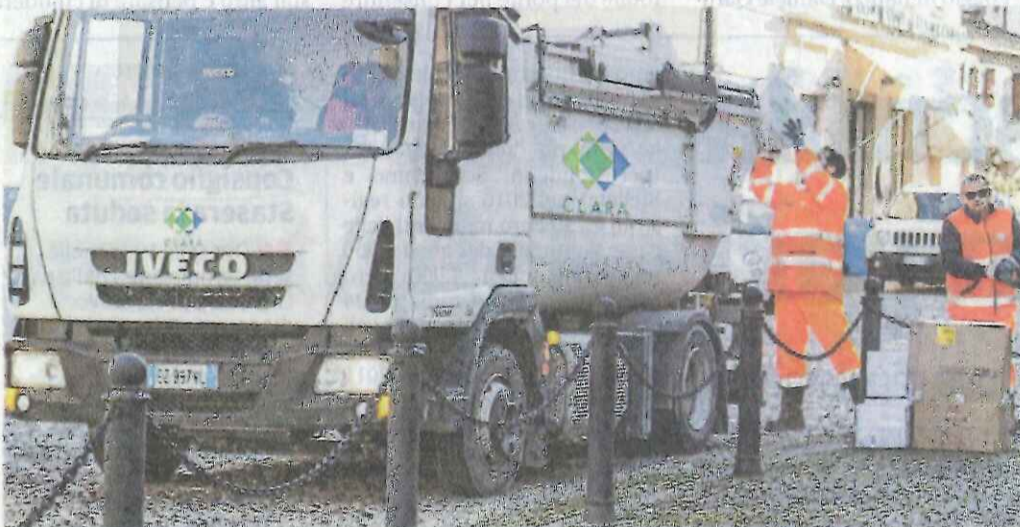
Operatori di Clara al lavoro per raccogliere rifiuti in centro storico a Cento